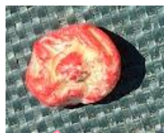
とうもろこしの種

ポットは園庭に持って帰ってきて、お当番さんが毎日水やりをしています。芽が出たら畑に植えます。