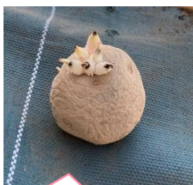
じゃがいもの種芋

じゃがいもは昨年春と夏の2回植えているので、子どもたちは慣れた手つきで、すみれぐみさんにも自信を持って植え方を教えてくれていました。